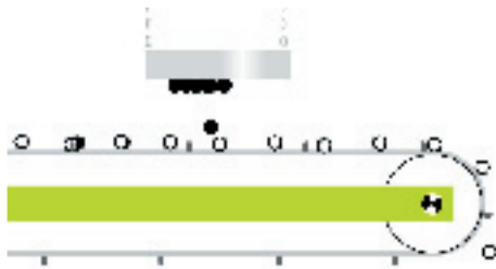
Anwendung als Überbandmagnet